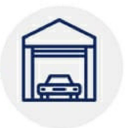
ГАРАЖ ИЛИ МАШИННОЕ МЕСТО

(не более 0,25 га общей площадью в городских или 1 га в сельских поселениях )